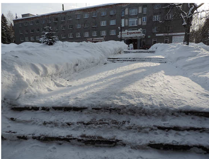
Территория парка до благоустройства